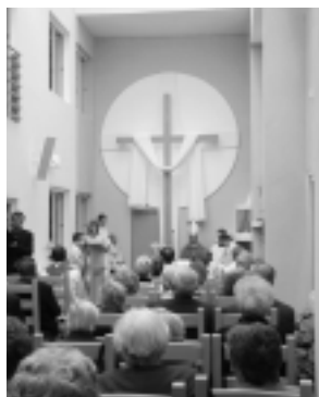
Súčasťou Denného stacionára svätého Medarda je aj rovnomenná ekumenická kaplnka.