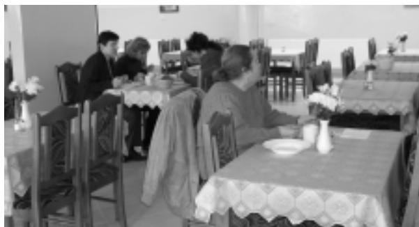
Pohľad do jedálne centra pre seniorov.