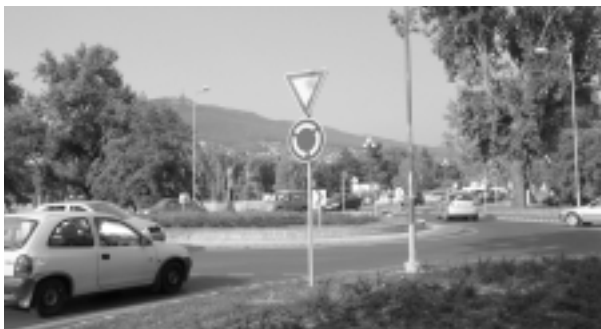
Kruhová križovatka ulíc Wilsonovo nábrežie, Napervillejská, Mostná a Parkové nábrežie jednoznačne urýchlila dopravu v smere zo Zobora. V rannej špičke sa tu nehromadia kolóny automobilov.

pomohol aj kruhový objazd na križovatke Wilsonovo nábrežie, Napervillejská ulica, Mostná ulica a Parkové nábrežie, ktorý je v prevádzke od augusta t.r. V krátkom čase k nemu pribudne druhá kruhová križovatka, na ktorú sa zmení klasický kruhový objazd pod Zoborom. (syn)