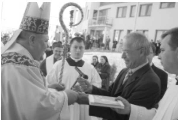
Zo slávnostného obradu konsekrácie Farského kostola sv. Gorazda v Nitre.